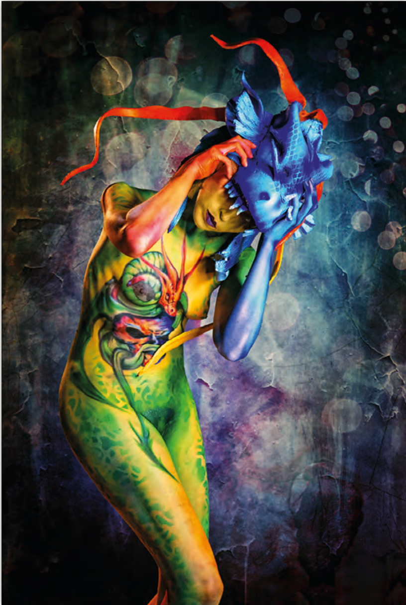
Beim Bodypainting wird der Körper zur Leinwand, das Aussehen wird völlig transformiert. Model: Iris. Bodypainting: Peter & Petra Tronser

Szene selbst gesteigertes Interesse an therapeutischen Einsatzmöglichkeiten des Modells besteht (vgl. Jerrentrup, 2018). Den Interviewten habe ich ferner zugesagt, ihre Identität nicht preiszugeben, wengleich keiner darum gebeten hat oder besonderen Wert darauf gelegt hat.